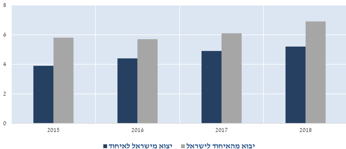
תרשים 1. מאזן סחר בשירותים בין ישראל לאיחוד האירופי (מיליארדי אירו)